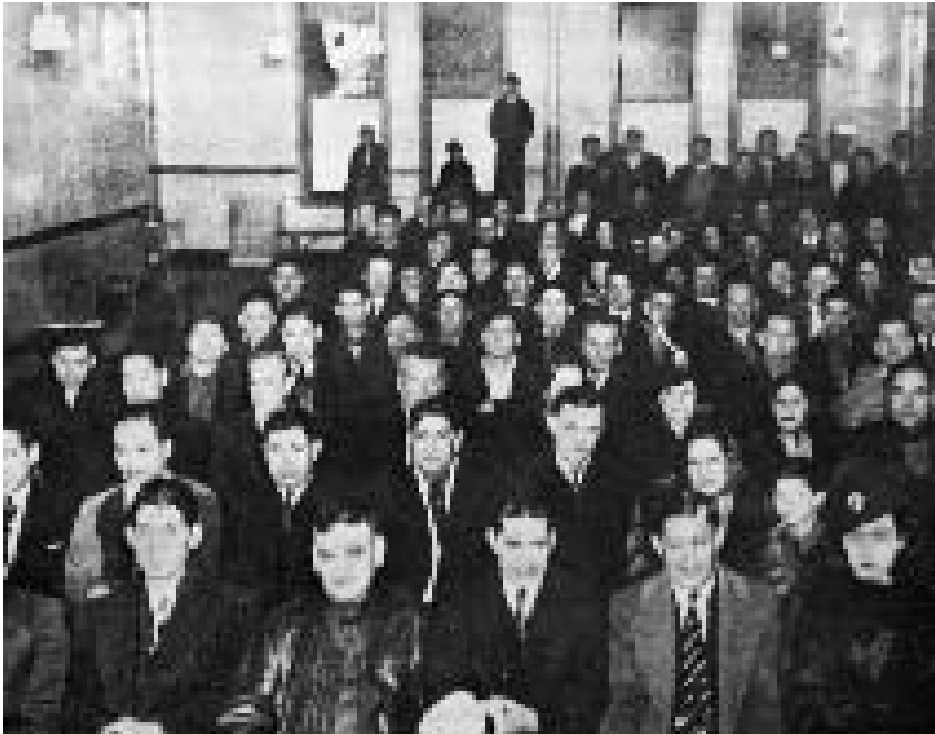
Fotografía 4. Reunión de obreros de las empacadoras. Chicago Historical Society, 1925.

de asistencia social –públicas, privadas, educativas, religiosas– a recibir diversos tipos de apoyos y servicios: comida, ayuda para conseguir empleo, pasajes de regreso a la frontera, educación para los niños, clases de inglés para los adultos, atención médica. En esas dependencias interrogaba a las trabajadoras sociales, médicos, ministros; observaba las interacciones; recopilaba información cuantitativa y comparativa; escuchaba, recogía y registraba con atención los puntos de vista subjetivos sobre las familias que atendían.