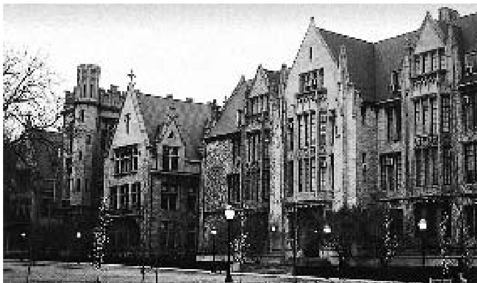
Fotografía 1. Edificio del Departamento de Sociología y Antropología de la Universidad de Chicago. Allí estudió Robert Redfield y era la sede del Local Community Research Program.